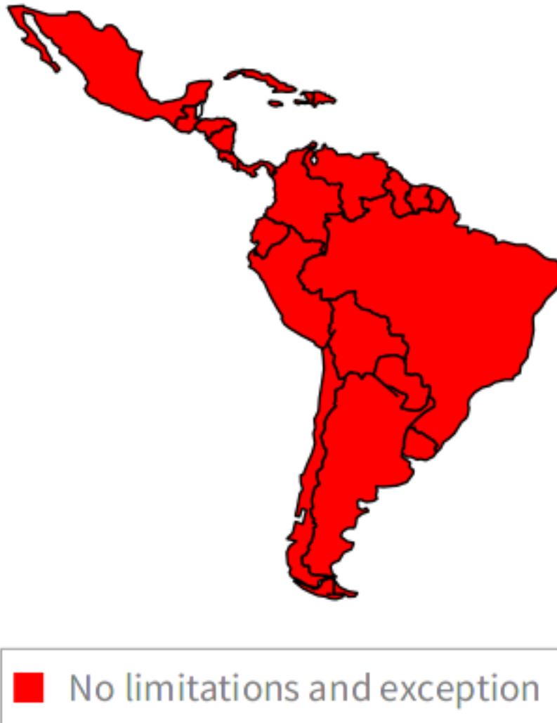
Figura 0.12: Limitación de responsabilidad para bibliotecas, archivos y sus funcionarios