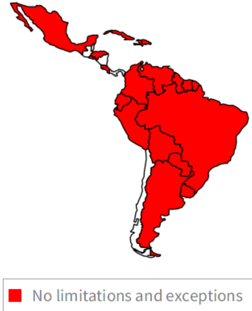
Figura 0.10: Formatos neutrales