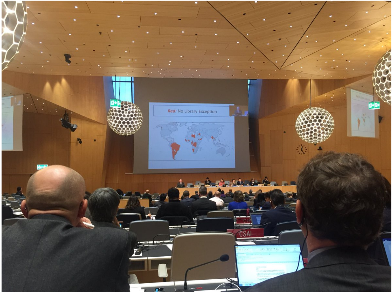
Figura 0.4: Imagen alusiva a la presentación en la OMPI del Estudio por el profesor Crews

Desde el enfoque Crews, de los 191 países, 161 de ellos tienen al menos una disposición que se aplica explícitamente a bibliotecas o archivos. Una lectura profunda al estudio ha permitido identificar que muchos países cuentan con algunas limitaciones y excepciones para bibliotecas, pero son insuficientes para cubrir las actividades misionales de bibliotecas y archivos. En este marco, hemos realizado un análisis comparativo del estudio Crews a partir de la Encuesta EIFL, una lista de verificación de excepciones para bibliotecas elaborada por Electronic Information for Libraries ( Core Library Exceptions Checklist. Does Your Copyright Law Support Library Activities And Services? que establece las disposiciones que toda ley de propiedad intelectual debería tener para apoyar el trabajo de las bibliotecas.