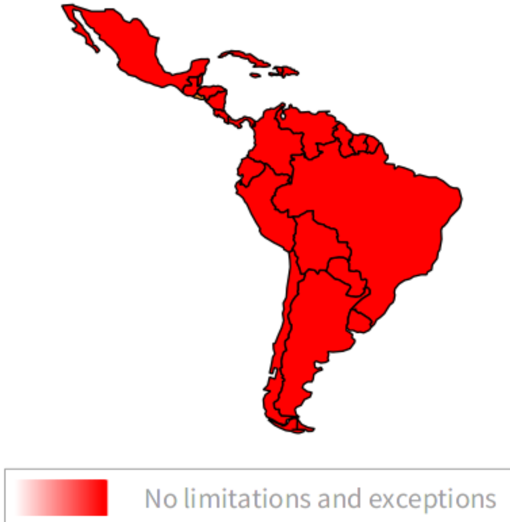
Figura 0.11: Salvaguarda de excepciones en entornos digitales

De las 2 posibles excepciones en la lista EIFL , ningún país tiene las dos.